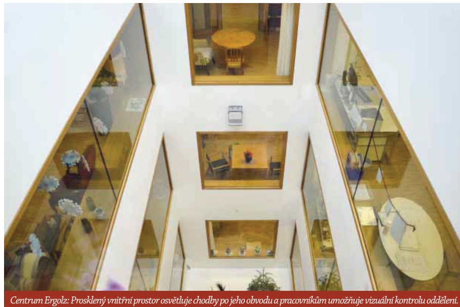
Centrum Ergolz: Prosklený vnitřní prostor osvětluje chodby po jeho obvodu a pracovníkům umožňuje vizuální kontrolu oddělení.