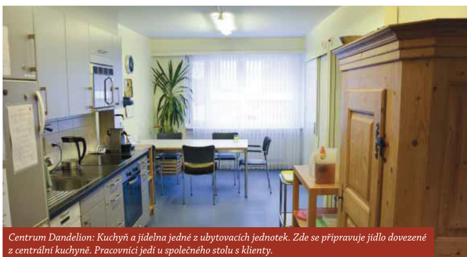
Centrum Dandelion: Kuchyně a jídelna jedné z ubytovacích jednotek. Zde se připravuje jídlo dovezené z centrální kuchyně. Pracovníci jedí u společného stolu s klienty.

Sub-projekt pokračuje realizací reciproční návštěvy švýcarských expertů v ČR, která se uskuteční v dubnu tohoto roku. Na zajištění odborného programu se podílejí obě partnerské organizace a účastníci první cesty. Následně bude vytvořena pracovní skupina složená z českých a švýcarských expertů, která se bude podílet na sestavení obsahu studie a definování doporučení k aplikovatelnosti švýcarských nástrojů do českého prostředí. Očekávanými výstupy práce expertní skupiny, které budou představeny na mezinárodním kulatém stole v závěru projektu v lednu příštího roku, je jednak vydání analýzy švýcarského systému poskytování péče o osoby s demencí a jinými specifickými potřebami, jednak doporučení pro české poskytovatele a veřejnou správu, které bude poukazovat na využitelnost a aplikovatelnost švýcarských nástrojů v české praxi včetně definování cílů pro přijetí opatření k zavedení nových principů. ■