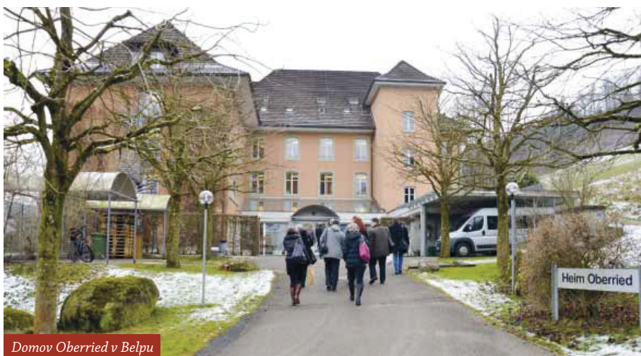
Domov Oberried v Belpu