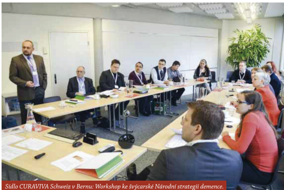
Sídlo CURAVIVA Schweiz v Bernu: Workshop ke švýcarské Národní strategii demence.

I toto zařízení se plně specializuje na cílovou skupinu osob s demencí. Důraz je kladen na vytvoření prostředí, ve kterém se uživatelé budou cítit jistě a jejich kvalita života zůstane zachována v co nejvyšší míře. Také zde jsou využívány prvky validace, konceptu Bazální stimulace, kinezetiky, velký důraz je kladen i na etiku a aktivizaci. Během tří let od nástupu do zaměstnání jsou všichni zaměstnanci proškoleni v těchto pěti oblastech, aby byla zachována kontinuita péče. Zařízení