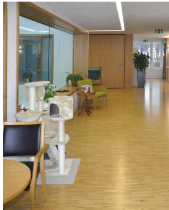
Centrum Ergolz: Chodby jsou široké, útulně zařízené ve starším stylu

Následující den účastníci navštívili společnost Sonnweid AG v kantonu Curych, která poskytuje služby 155 osobám se středním až těžkým stupněm demence.