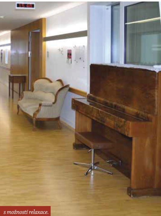
s možností relaxace.

se skládá z několika budov, kde žijí klienti v různých fázích onemocnění. V bytových jednotkách je denní režim podobný chodu domácnosti a uživatelé se ve vysoké míře zapojují do domácích prací. Ošetřovatelské stanice jsou určeny pro osoby vyžadující zvýšenou péči. V tzv. oázách žijí klienti v terminálním stádiu onemocnění. Oázy jsou velké ošetřovatelské místnosti až se šesti lůžky. Tato integrace klientů má za cíl co nejvíce udržet sociální kontakt uživatele s okolím a pod-