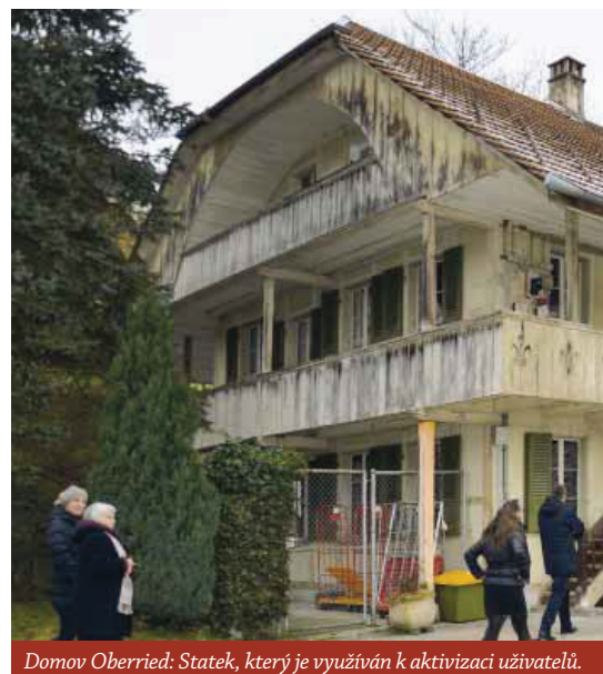
Domov Oberried: Statek, který je využíván k aktivizaci uživatelů.