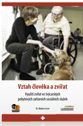
Vztah člověka a zvířat Využití zvířat ve švýcarských pobytových zařízeních sociálních služeb