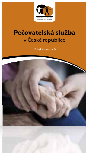
Pečovatelská služba v České republice Kolektiv autorů, APSS ČR