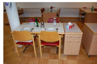
Skříňka u jídelního stolu

Dalšími příklady dobré praxe jsou např. pronájem reklamních prostor ve výtahu, skříňka na osobní věci u jídelního stolu nebo online systém informující o obsazenosti domovů, do kterého má přístup jakýkoli občan Švýcarska.