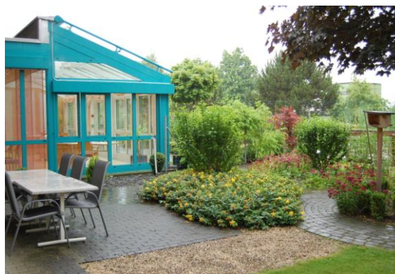
Uzavřená zahrada s nekonečnými cestami

Některé příklady dobré praxe se týkaly i zaměstnanců a pracovního prostředí: